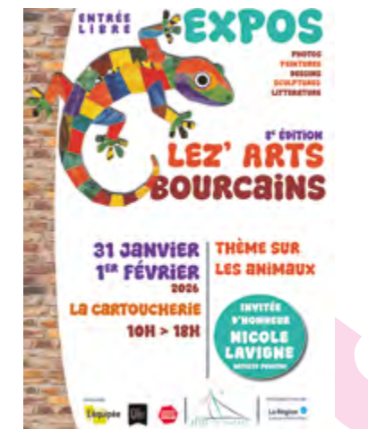
Exposition Lez'Arts Bourcains Samedi 31 janvier et dimanche 1er février