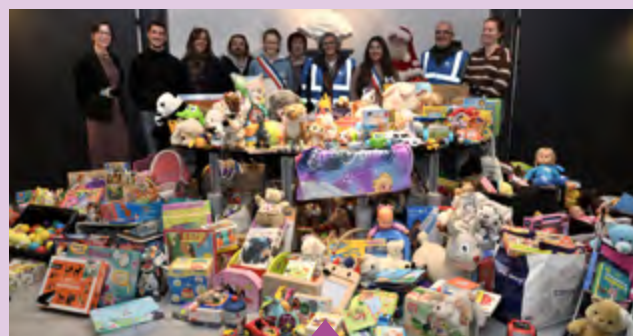
8 décembre – Remise de cadeaux au Secours populaire et remerciements aux bénévoles