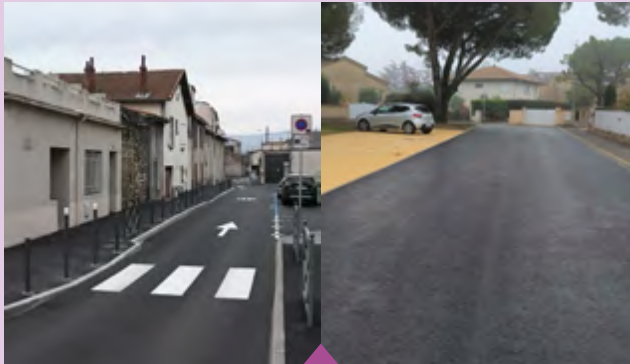
15 octobre – Rénovation de la rue de l'Egalité et de la rue Hippolyte Fizeau