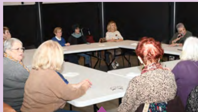
2 décembre – Goûter des Dames de cœur