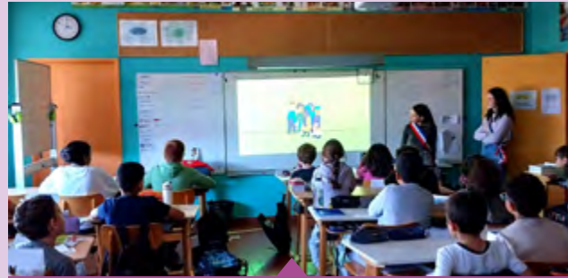
Du 6 au 12 novembre – Diffusion du film « Mauvais souvenir » réalisé par le Conseil Municipal des Jeunes, dans les établissements scolaires, à l'occasion de la semaine de lutte contre le harcèlement scolaire