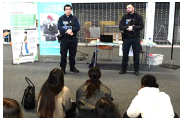
Sensibilisation à la sécurité routière des élèves de 1ère du lycée Les 3 Sources par la police municipale

Participez avant le vendredi 16 janvier 2026 au questionnaire (anonyme) disponible sur le site internet de la Ville : www.bourg-les-valence.fr