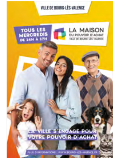
Maison du Pouvoir d'Achat aux horaires d'ouverture de la mairie (sauf le jeudi après-midi) ou par téléphone : 06 09 67 92 96

Venez bénéficier des offres négociées à tarif préférentiel par la municipalité : mutuelle santé, assurance habitation, alarme individuelle, assurance animale, dispositifs anti-moustiques, fioul, bois de chauffage, énergie verte...