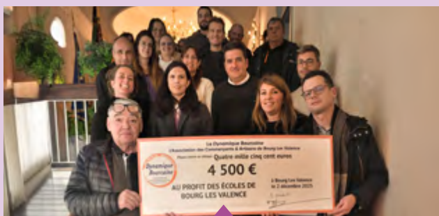
2 décembre – Remise de chèque de l'association des commerçants la Dynamique bourcaine à toutes les écoles de la ville