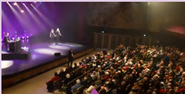
1er décembre – Spectacle de Noël « 100% Sardou » offert aux seniors au théâtre le Rhône - En partenariat avec les magasins Lidl et Grand Frais