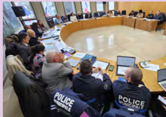
21 novembre – Réunion du Conseil Local de Sécurité et Prévention de la Délinquance