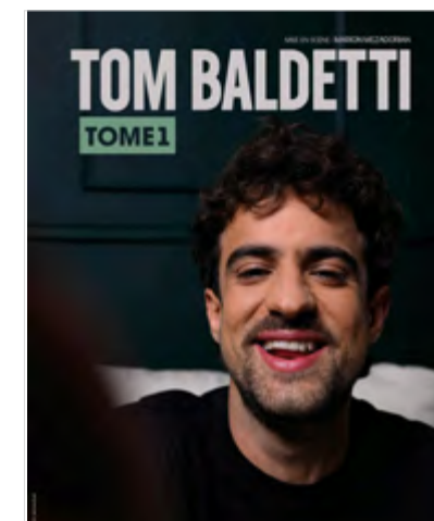
Humour- Tom Baldetti « Tome 1 » Jeudi 15 janvier – 20h