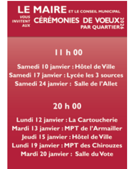
Cérémonies de vœux par quartier Du samedi 10 au samedi 24 janvier