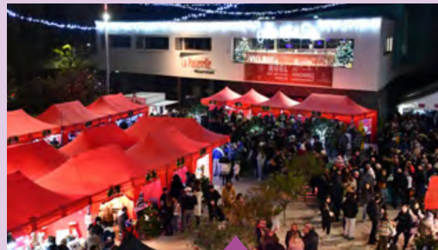
29-30 novembre – Village de Noël avec nos villes jumelles