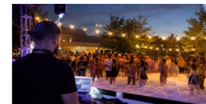
Soirée mousse – Braserio et DJ