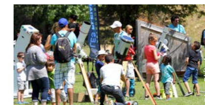
Observation du soleil