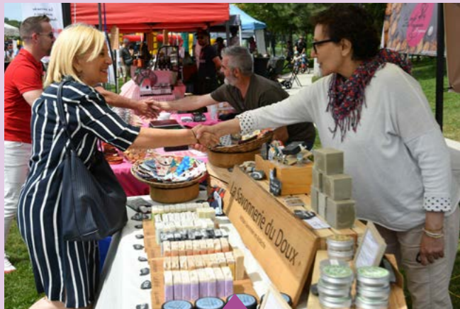
7 juin – Family Day des commerçants