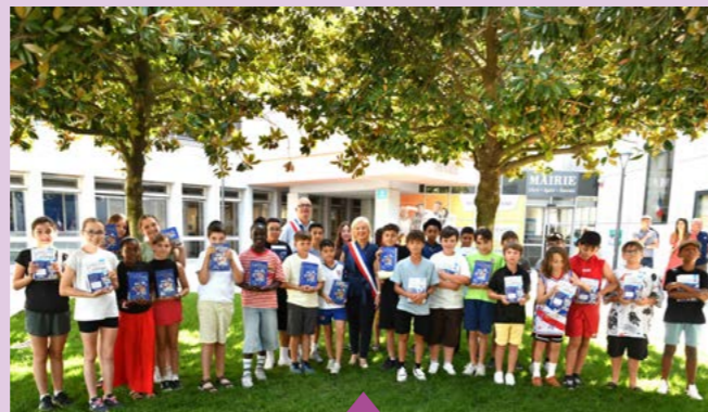
17 juin – Remise des dictionnaires aux élèves de CM2