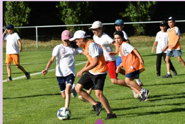
12 juin - Tournoi de football périscolaire inter-écoles