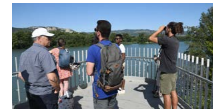
Découverte des oiseaux migrateurs avec la LPO