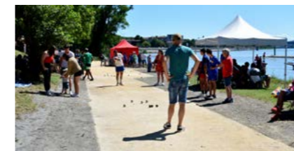
Tournoi de pétanque