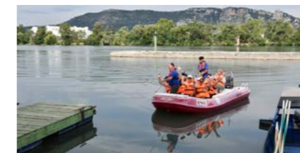
Balades en bateau sur le Rhône