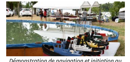
Démonstration de navigation et initiation au pilotage de modèles réduits de bateaux par la mini-flotte du 45e parallèle