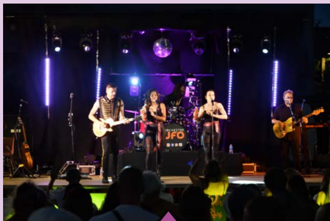
13 juin – Festival MusiKàBourg