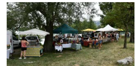
Marché de producteurs et artisans locaux