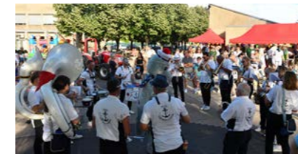
Animation festive et musicale place Elie Cester (Allet)