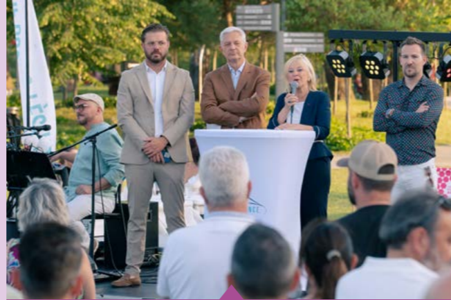
28 mai – Cocktail de l'économie