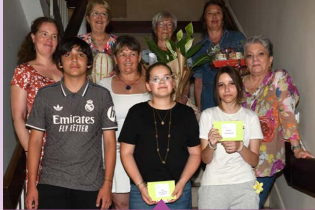
26 mai – Les gagnants de la dictée intergénérationnelle