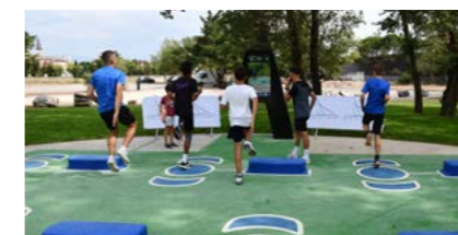
Fitness en plein air