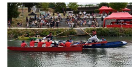
Challenges de joutes