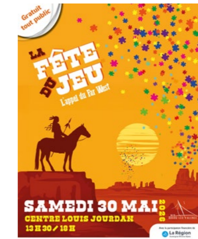
Fête du jeu Samedi 30 mai de 13h30 à 18h

Salle des mariages - mairie Vous avez 60 ans et + et souhaitez participer ? Pré-inscriptions du 4 au 7 mai par mail : laurence.philippot@bourg-les-valence.fr (inscriptions limitées à 24 places)