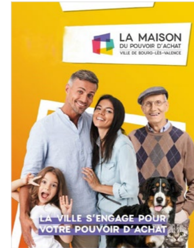
Maison du Pouvoir d'Achat aux horaires d'ouverture de la mairie (sauf le jeudi après-midi) ou par téléphone : 06 09 67 92 96

Venez bénéficier des offres négociées à tarif préférentiel par la municipalité : mutuelle santé, assurance habitation, alarme individuelle, assurance animale, dispositifs anti-moustiques, fioul, bois de chauffage, énergie verte...