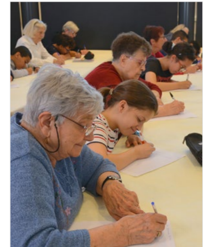
Dictée intergénérationnelle Mardi 26 mai à 14h30

Salle des mariages - mairie Vous avez 60 ans et + et souhaitez participer ? Pré-inscriptions du 4 au 7 mai par mail : laurence.philippot@bourg-les-valence.fr (inscriptions limitées à 24 places)