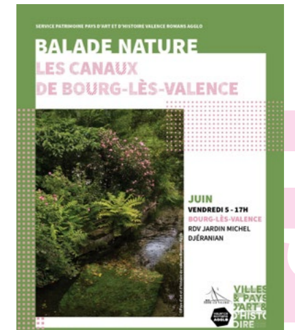
Balade nature autour des canaux organisée par le service patrimoine pays d'art et d'histoire de Valence Romans Agglo

Centre Louis Jourdan 114, chemin du Valentin