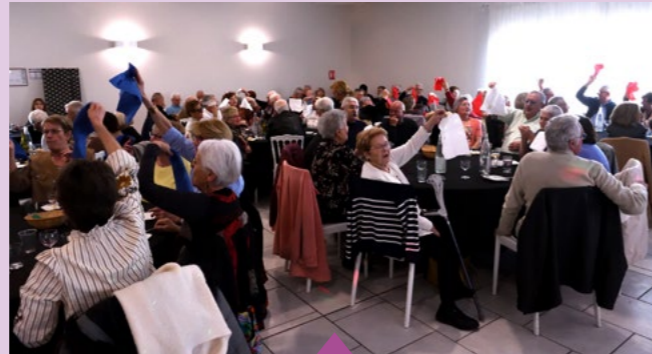
24-27 février – Repas offert par le CCAS aux seniors de 65 ans et plus