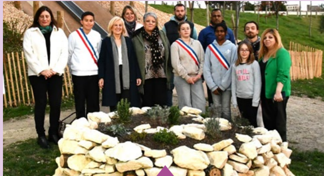
23 février – Inauguration de la spirale de la biodiversité réalisée par les élus du Conseil municipal des jeunes, en partenariat avec la Ligue pour la Protection des Oiseaux