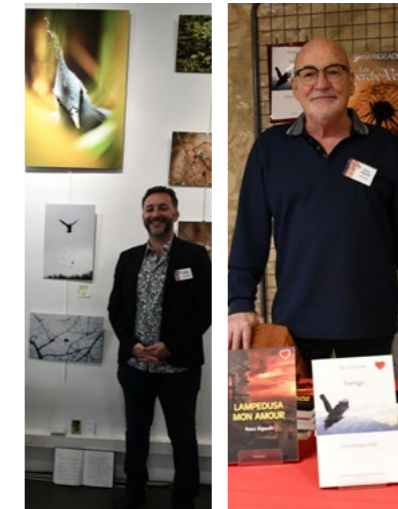
Exposition des photos de Jérôme Marquet et des livres de Raoul Rigeade Du lundi 20 avril au vendredi 15 mai

Esplanade de l'Île-parc Girodet – Théâtre le Rhône