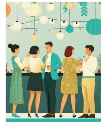
Cocktail de l'économie à destination des commerçants, artisans, chefs d'entreprises, professions libérales, agriculteurs... installés sur la commune