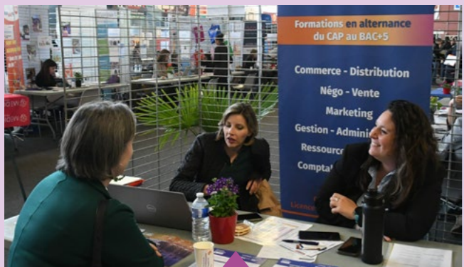
15 avril – Salon de l'alternance, de l'apprentissage et de l'emploi