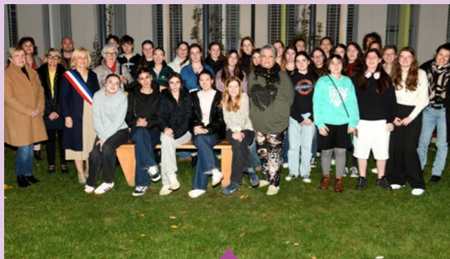
25 février – Rencontre avec les jeunes Allemands de la ville jumelle d'Ebersbach an der Fils et les lycéens du Valentin