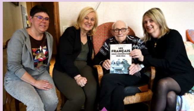
5 mars - Centenaire de Robert Chaidron