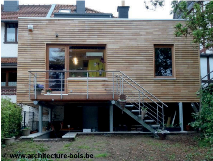
Habitat sur pilotis