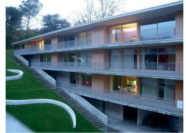
Mendrisio - Italie