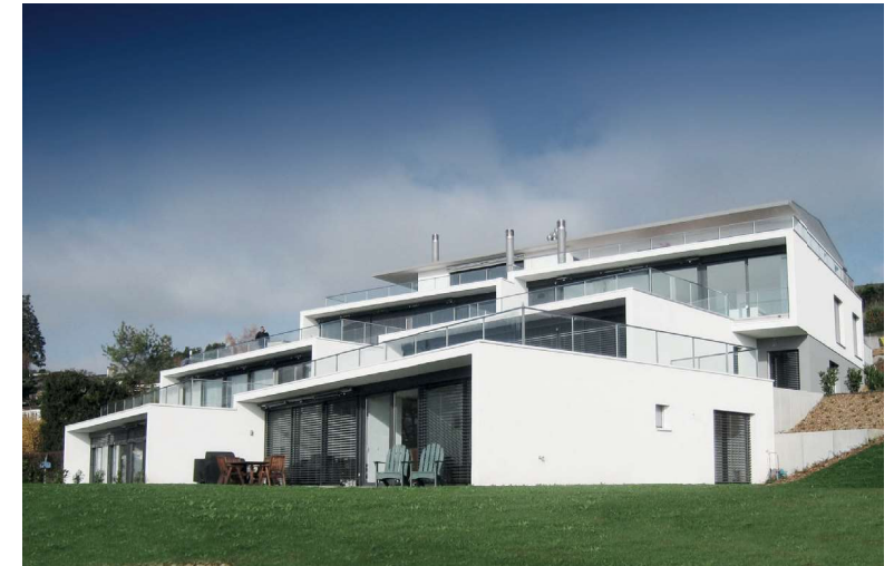
Les Terrasses Blanches, Lutry - Suisse