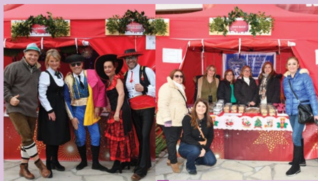
30 novembre-1 er décembre – Village de Noël avec nos villes jumelles