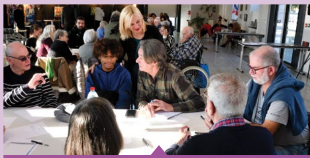
16 novembre-10 décembre – Second cycle d'ateliers participatifs du dispositif de concertation citoyenne "BLV 2030"