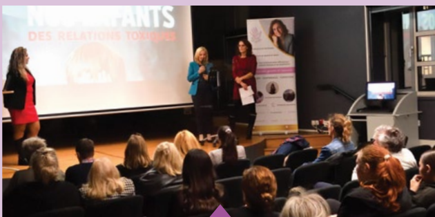
25 novembre – Conférence "Protéger nos enfants des relations toxiques" dans le cadre de la Journée internationale de lutte contre les violences faites aux femmes