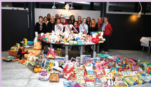
9 décembre – Remise de cadeaux au Secours populaire