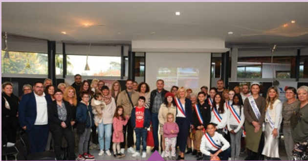
9 novembre – Cérémonie d'accueil des nouveaux arrivants