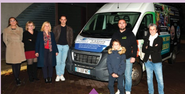
12 novembre – Remerciements aux entreprises partenaires du financement du véhicule du CCAS