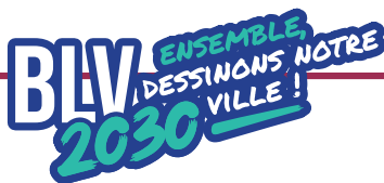
Plate-forme de concertation citoyenne : inscrivez-vous pour participer aux projets de la municipalité

Créé dans la continuité de la démarche de concertation citoyenne "BLV 2030", ce nouvel outil numérique permet de recueillir vos avis et propositions en complément des ateliers participatifs. À plus long terme, sa vocation est de devenir une véritable interface de dialogue et de favoriser l'implication de l'ensemble des citoyennes et des citoyens dans la vie et les projets de la municipalité.